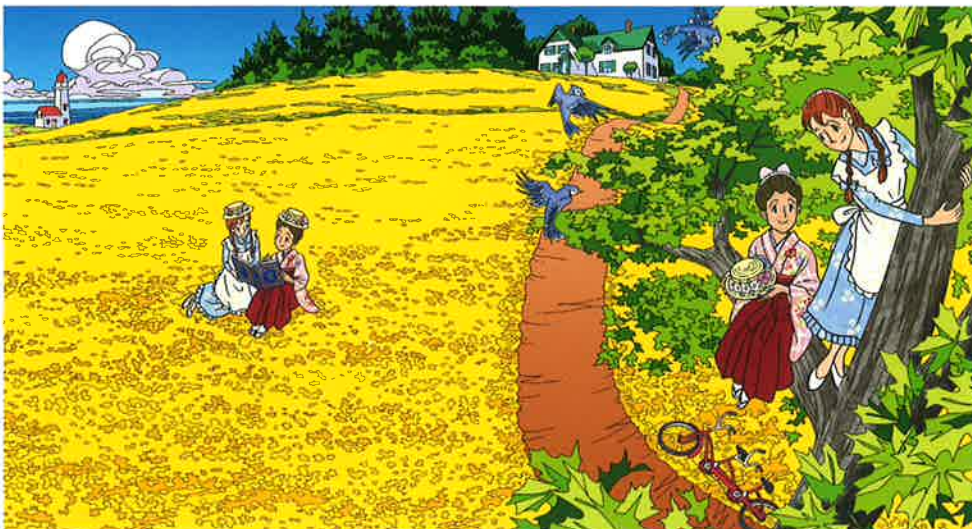
新作「アンを抱きしめて 村岡花子物語」(表紙) 2014