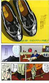
「ハートカクテル」 (「ウイングチップの忠告」より) 1988