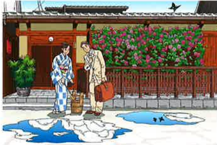
池坊会報誌(2002年8月号表紙) 2002