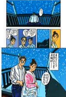
「粟～ふたたび～」 (「第一話 とっておきのピンク色」より) 2007