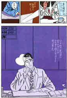
「ハートカクテル」 (「悪い出ワンクション」より) 1986