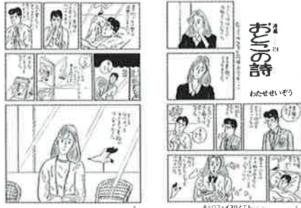
「おとこの詩」(「キミのフェイスはとても」より) 1984