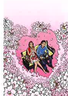
108' 春びあ(表紙) 2008