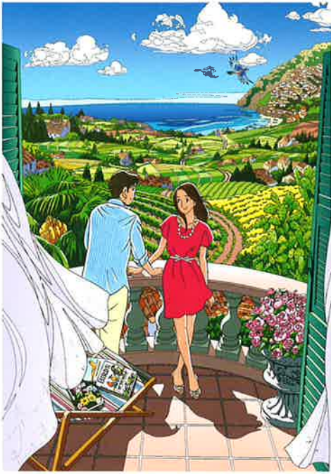
新作「風の景色～ふたりのシンフォニー」2014